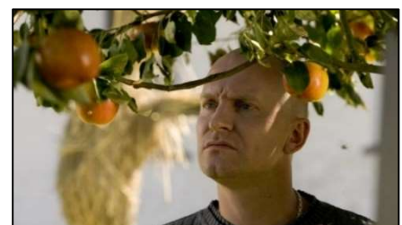
Beeld uit de film Adams Appels

Enkele vaste vrijwilligers assisteren bij de filmavond, m.n. voor het openen en sluiten, de ontvangst, de zaalinrichting en de consumpties.