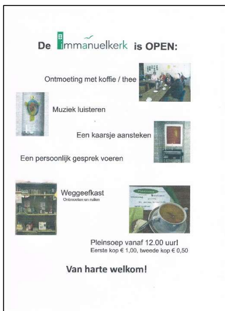
Straatbord Open Kerk

In 2023 'draaide' de Open Kerk op woensdag weer op volle toeren! Geen corona-afstanden meer, de tafelopstelling is gelijk gebleven maar de stoelen kunnen weer dicht op elkaar staan. Met vreugde constateren de vrijwilligsters dat de populariteit nog steeds toeneemt. Regelmatig zijn er 30 tot 35 bezoekers! Veelal bekenden uit de kerkelijke kring, maar ook regelmatig 'mensen van buiten de eigen kring'. Ook daar zijn heel trouwe bezoeker(st)ers onder. Prettig is dat verder de verhouding dames / heren nu veel evenwichtiger is dan dat deze eerder was. Meestal is de Open Kerk in zaal 4, wat met de grote groep bijna noodzakelijk is. Een enkele keer is zaal 4 bezet en wordt zaal 6 gebruikt. Voor een keer kan dit best (veel 'makke schapen in een hok'), maar de grotere zaal wordt de keer daarop wel weer erg op prijs gesteld.